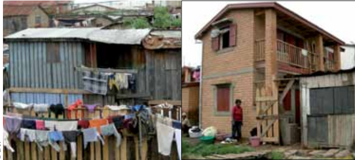
À gauche, la cabane en bois où vivaient 10 personnes, à droite, la nouvelle maison construite grâce à un microcrédit. Coût: 3 600 €, financé aux 2/3 par les familles.

ont été construites ou réhabilitées en lieu et place de taudis et 150 latrines communes érigées. ENDA travaille en relation avec d'autres acteurs sociaux qui interviennent dans les secteurs de la santé, de la malnutrition, des violences conjugales développant ainsi une vraie dynamique. ■